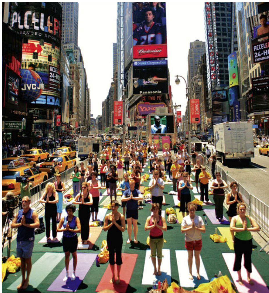
Yoga-Demonstration auf dem Times Square in New York: Gucci-Matten für 850 Dollar

Iyengar ist ein Mann des Körpers. Er sagt, Yoga sei etwas für praktische Menschen mit praktischen Problemen. Der frühere Tennisprofi John McEnroe und der achtfache Surfweltmeister Kelly Slater machen Iyengar-Yoga, für den indischen Cricket-Verband, einem der größten der Welt, hat er sogar ein Buch mit Übungen zusammengestellt. Manchmal schaut er sich im kleinen Wohnhaus hinter dem